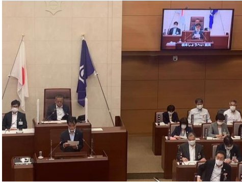
登壇中のひとコマ。次は高画質カメラで撮りたい

9/7(月)目黒区議会 第3回定例会の初日、 一般質問で登壇しまし、 GIGAスクール構想(小中学校の児童 生徒全員にパソコン またはタブレット端 末を1人1台配備する文部科学省肝煎りの政策)と、 目黒区の基本構想(21世紀半ばに向 けた長期計画)について尋ねました。