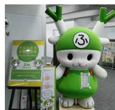
左)庁舎はレンガ調、屋上には災害時にも役立つ太陽光パネルも敷設。右)地域の人気者、ふっかちゃん

※ICT(Information and Communication Technology) …情報通信技術。