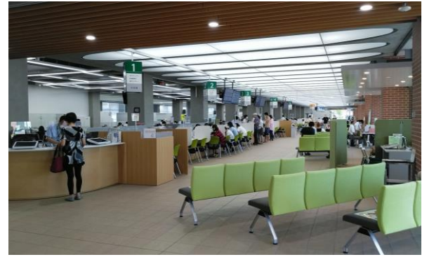
一般市民向けの窓口はワンフロアで完結、段差もありません

8/13(水) 実家のお墓参りのついでに、ICT(※)の導入で便利になった深谷市役所(埼玉県)の新庁舎(7月下旬OPEN)を見に行きました。記載台をなくし、来庁者の氏名や住所などは免許証やマイナンバーカードで機械が読取ります。手続きする部署ごとに利用者が何度も氏名や住所を記入する手間も、行政側の入力作業(&その人件費)も無くす画期的な仕組み。実は昨秋にデジタル技術の先進的な自治体を紹介するセミナーで知ってから、楽しみにしていました。こうしたご時勢なので今回は独りで足早に回っただけですが、新しい時代を感じさせる建物にはワクワクします。目黒区でも情報化推進計画に沿って、区民サービスの向上や業務の効率化を図(はか)っていますが、今の計画は令和2年度までの5年間。次の計画(コロナ禍で策定は遅れる見込み)に向けて、この分野にもアンテナを張り続けていきたいです。